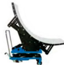
Inductor Tipo C