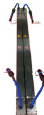
Inductor Tipo Placa