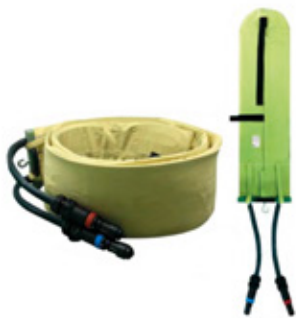
Inductor Tipo Manta